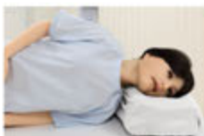
仰臥位と側臥位の体位変換可能

【寸法 mm】 ロボット / W420xL1000xH260 カート / W620xL1000xH1550 【材質】 皮ふ / シリコンゴム